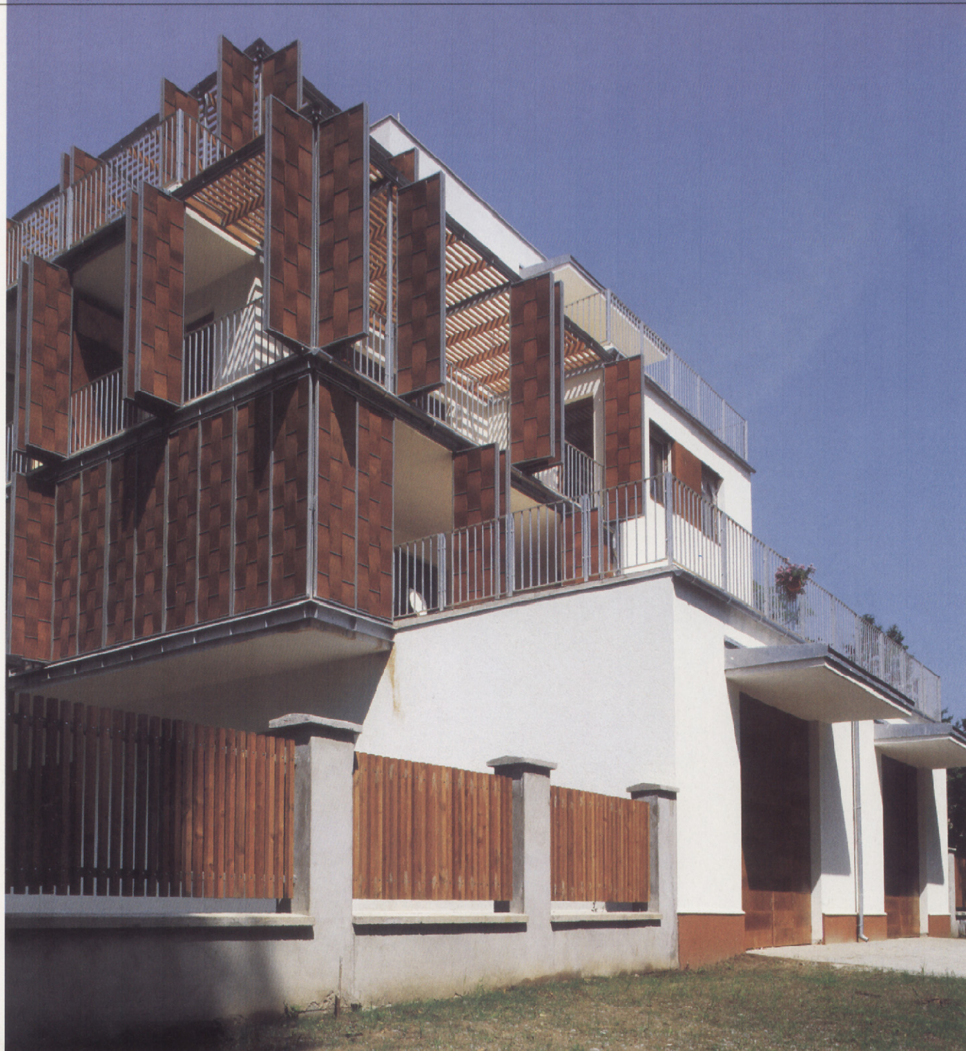
A mediterrán architektúra pergolás, árnyékolós alapélményéből merítve az összkép rendkívül változatos, vibráló. A véletlenszerűen kinyitott vagy becsukott, préselt falemez árnyékolók mélységet adnak az épületek homlokzatainak

Az óbudai Duna-part átalakulásának érzékeltetésére említhetjük a nemrégiben elkészült Aquincum-i villaparkot, túl az összekötő vasúti hídon a már megépült Római Wellness Otthon Lakóparkot, mellette pedig a Nánási Kert első házait, melyekbe éppen beköltözhetnek a lakók. Néhány telekkel feljebb pedig dolgoznak már a következő lakópark alapjain.